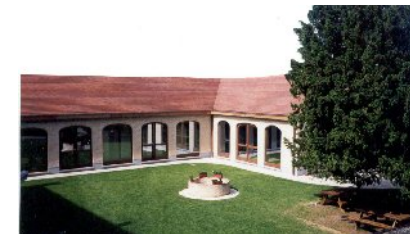
OBSG ResidenceClub van Eyck