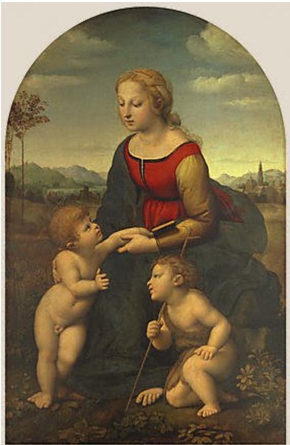
LA VIERGE, L'ENFANT JÉSUS ET JEAN-BAPTISTE