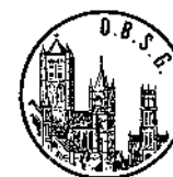
Ontmoeting Buitenlandse Studenten Gent vzw