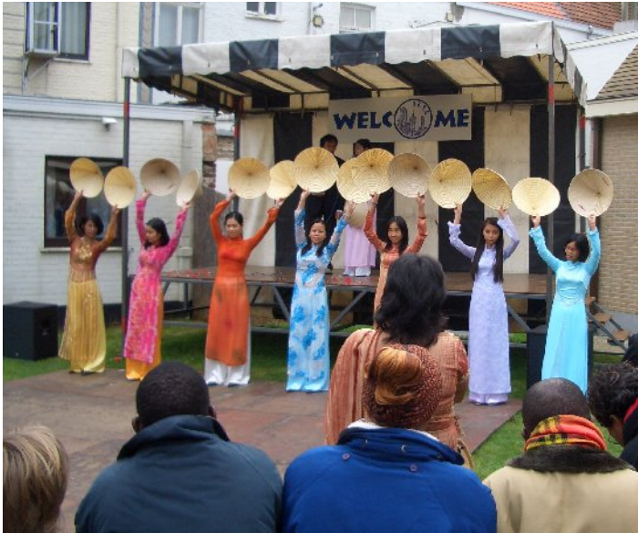
Dansende Vietnamese studentinnen